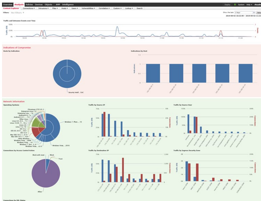
Billede 3. Eksempel på en af mange skærbilleder som viser aktivitet baseret på systemer med unormal adfærd. Bemærk hvor meget Facebook og YouTube mandag morgen fylder i trusselsbilledet på Vestforbrænding.

Igennem de næste par uger skifter vi fra de gamle firewalls til de nye. Da vi har fuld redundans i de gamle og nye, forventer vi ikke nogen driftstop – vi vil dog alligevel annoncere servicevinduer på intranettet som sædvanlig.