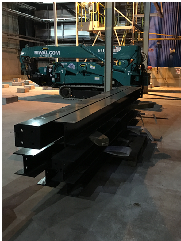
Montering af stålkomponenterne sker efter en nøje tilrettelagt monteringsplan, idet arbejdsforholdene omkring monteringen er udfordrende grundet den snævre plads i den eksisterende røgrensbygning.