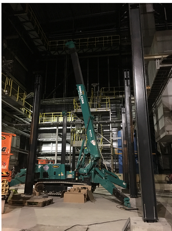
Stålsøjlerne rejses med en el-drevet kran.